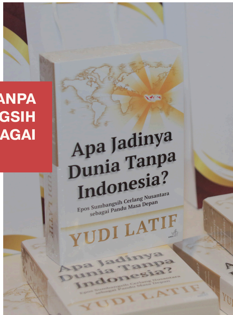
Karya Yudi Latif

Diharapkan, “Buku ini dapat membuka cakrawala baru dengan perspektif yang berbeda bagi pembaca untuk memahami sejarah panjang